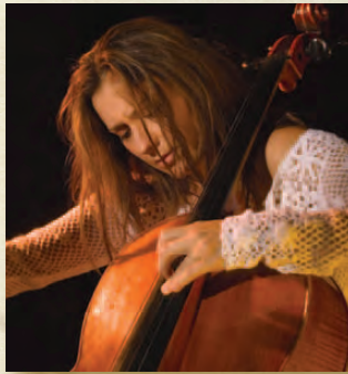
Velitchka Yotcheva Violoncelle / Cello